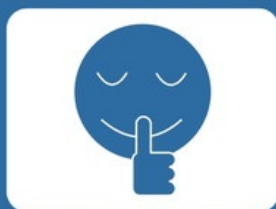
会話を控えるよう お願いします