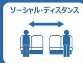
ソーシャル・ディスタンス