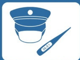
乗務員のマスク着用・健康管理