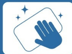
定期的な清掃・消毒