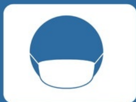
マスクの着用を お願いします