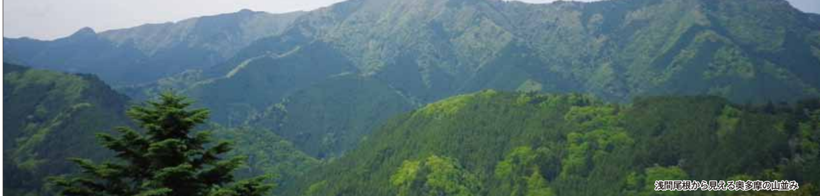
浅間尾根から見える奥多摩の山並み

武蔵五日市駅 ◀▶ 弘沢の滝入口 (ほっさわのたき) ▶▶ 浅間嶺 (せんげんれい) ▶▶ 浅間尾根登山口 ▶▶ 武蔵五日市駅