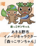
あきる野市イメージキャラクター「森っこサンちゃん」

① 東京都あきる野市留原284-1 (「小峰公園」バス停下車すぐ) ☎042-595-0400 ② 常時開園/ビジターセンター 9時～16時30分 ③ ビジターセンター 月曜 (祝日の場合は翌平日、夏休み期間は除く)、年末年始 (12/29～1/3)