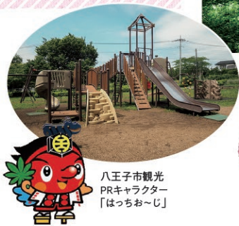
八王子市観光PRキャラクター「はっちお〜じ」