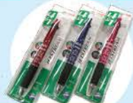
ジェットストリーム(ボールペン)