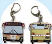
アクリルキーホルダー