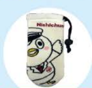
ペットボトルホルダー