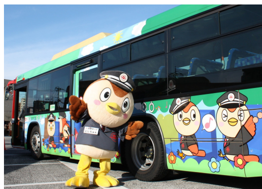
《西東京バス公式キャラクター・にしちゅん》