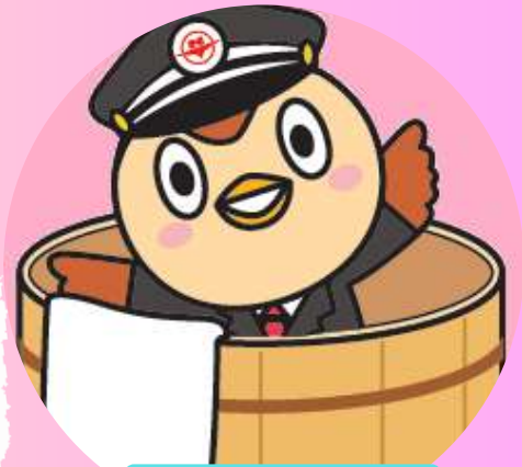
西東京バスキャラクター (にしちゅん)